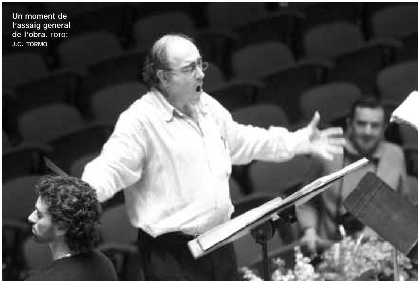
Un moment de l'assaig general de l'obra.

Un tret característic de les obres de Santos, present també en aquesta composició, és la seua teatralitat, que va incloure moviments gesticulars del cor. L'intel·ligent eclecticisme del músic de Vinaròs —que segueix la màxima del rètor llatí de Calahorra, Quintilià— ha combinat sàviament diversos elements. D'una banda, els esquemes rítmics repetitius dels instruments, ostinati , tot seguint procediments constructius similars al llenguatge minimalista. Amb ells va assistir eficaçment un cant bàsicament declamat. Els esquemes repetitius vocals, en canvi, són d'una índole ben diferent, i s'hi arriba al fraccionament sil·làbic en alguna paraula entre els solistes i el cor. Santos tampoc no ha deixat de banda el procediment compositiu