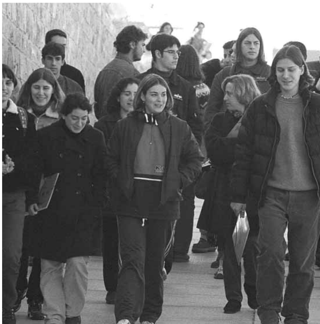
Participants en el programa Conéixer d'una edició anterior.

Un altre aspecte important en l'oferta formativa de la Universitat són les carreres tèc-