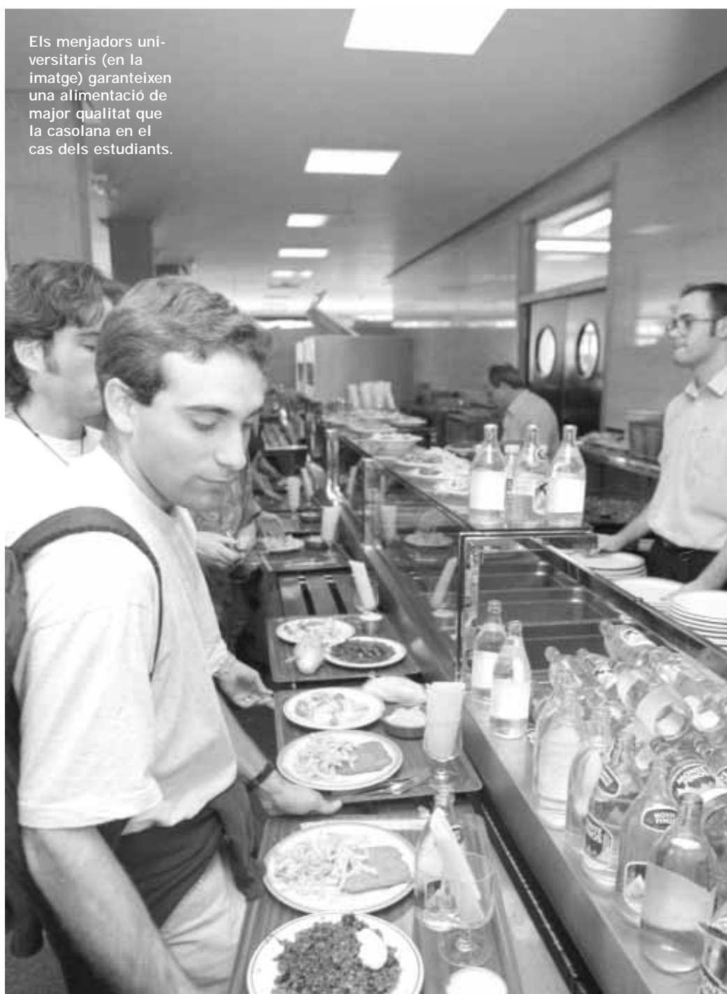
Els menjadors universitaris (en la imatge) garanteixen una alimentació de major qualitat que la casolana en el cas dels estudiants.

La situació es complica quan les faenes de la casa es comparteixen amb els companys, s'ha de fer la compra en comú, establir una hora per a dinar, fer un horari amb els torns de cuina i, allò més important, el menú ha d'agradar a tots. Així doncs, molts joves han d'afegir al seu horari de classe les hores extra que suposen les tasques domèstiques, sobretot a la cuina. Tots aquests factors no sempre es