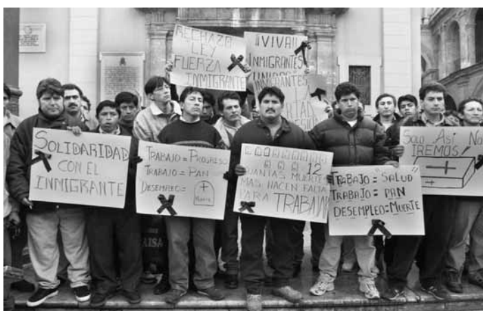
Manifestació d'immigrants equatorians.

3. La llei 8/2000 és inacceptable com a marc jurídic de la immigració, perquè vulnera la Constitució i el respecte als instruments jurídics internacionals bàsics que ens obliguen. Els drets humans negats en la llei 8/2000 no són una utopia desitjable, ni tan sols una aspiració versemblant. El seu reconeixement és un deure imposat per l'article 10 de la Constitució vigent. A més, la llei no pot perseguir la integració, com diu el seu mateix títol, quan el seu objectiu prioritari, inclús obsessiu, és el control dels fluxos migratoris i l'establiment d'un grup, els irregulars, en termes de fobotipus, origen de tots els mals. L'irregular, amb aquesta llei, no sols està sense papers: és una no persona i per això sense drets, perquè cal fer-lo invisible: no ha d'existir.