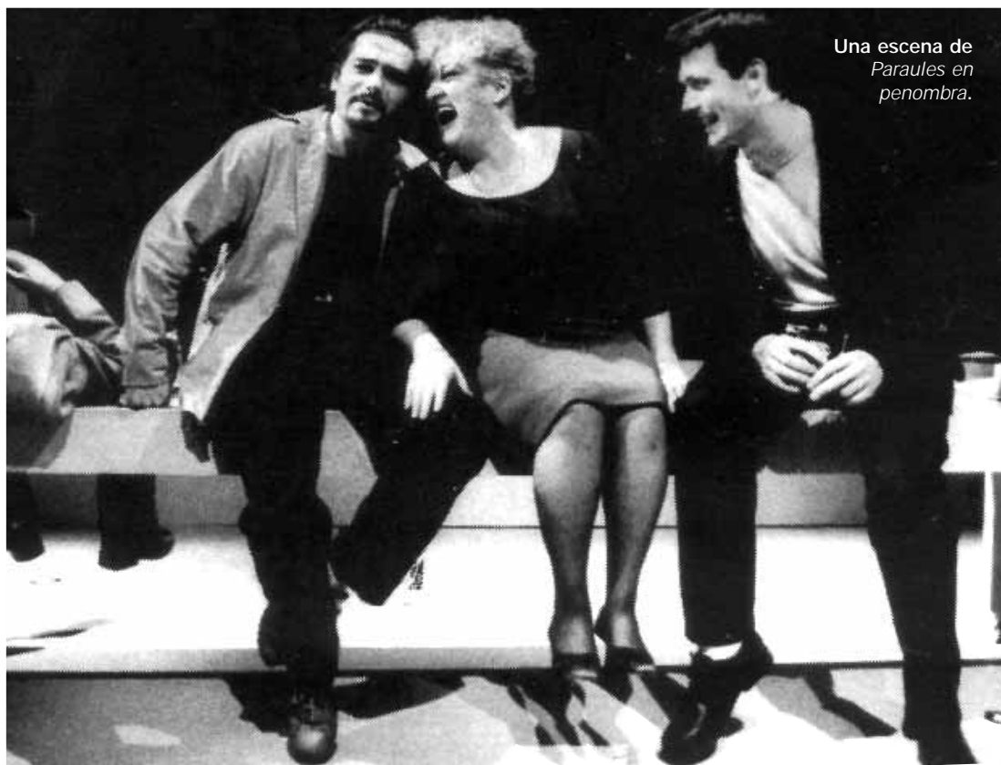
Una escena de Paraules en penombra .