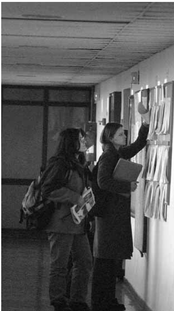
Sala de la Muralla del Col·legi Major Rector Peset.

El dimecres també es realitzarà una taula redona sobre L'ensenyament de l'alemany en diferents àmbits educatius . Mentre que el dijous a les 20:00 hores se celebrarà el concert de Pedro Aznar Quartet (jazz) a la