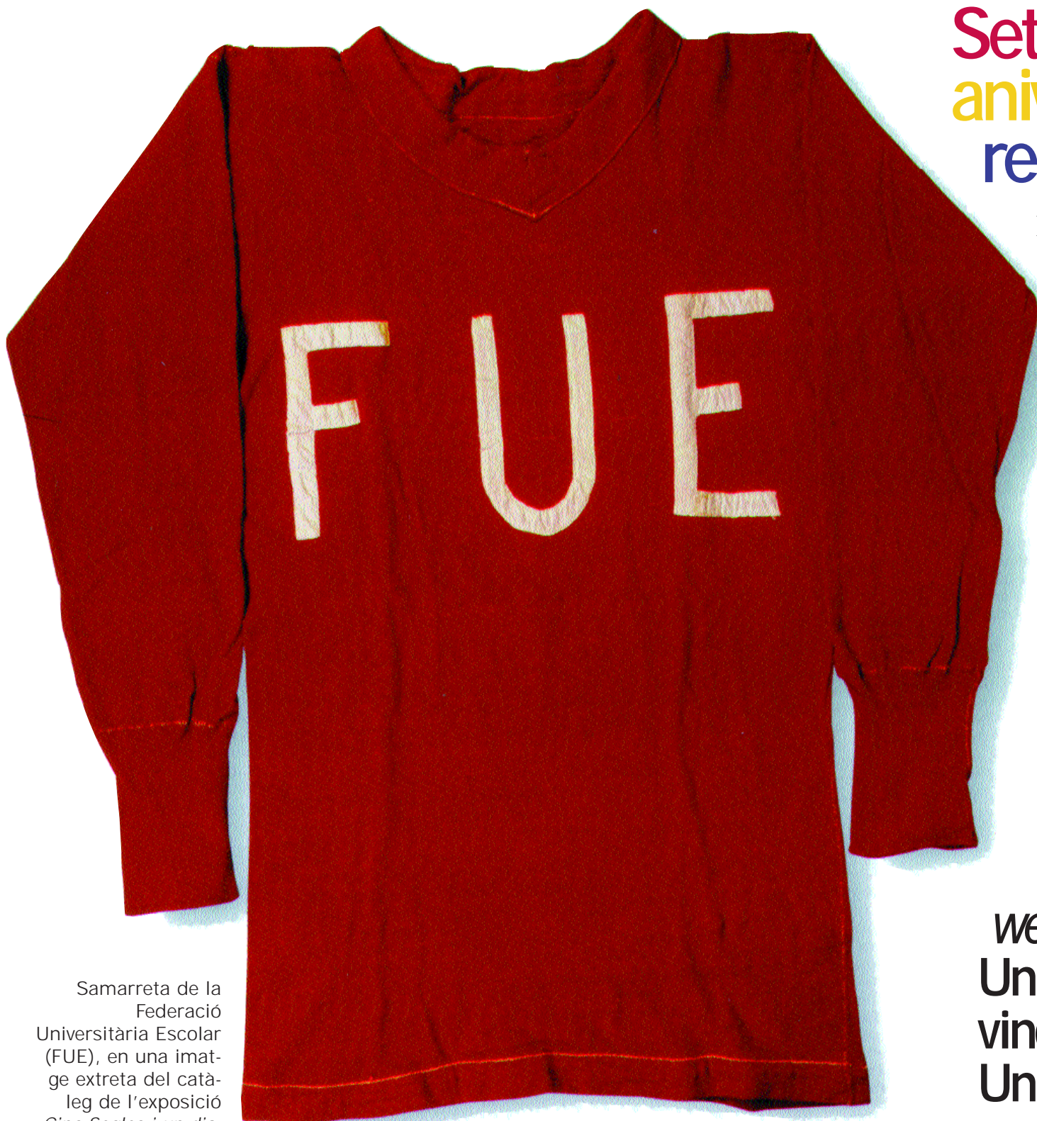
Samarreta de la Federació Universitària Escolar (FUE), en una imatge extreta del catàleg de l'exposició Cinc Segles i un dia .

El 92% dels titulats per les universitats de València, Jaume I i Alacant ha treballat en acabar la carrera. Així es desprèn de les conclusions d'un informe elaborat per professors de diversos departaments que serà presentat en breu. Segons les dades de l'informe, molts joves troben ocupació fins i tot mentre estan estudiant. Pàg. 3