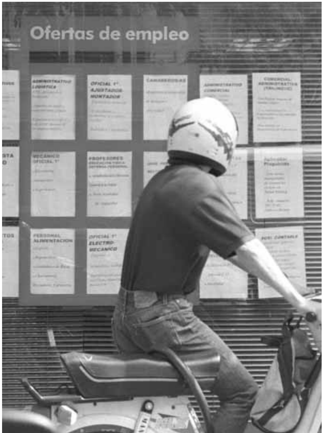
Un jove passa per davant d'una oficina d'ocupació.

En l'estudi, a banda de qüestions metodològiques, es fa una anàlisi del període de formació acadèmica (accés, rendiment, complements de formació) dels titulats, la seua situació actual en el mercat de treball (adequació a la seua formació, origen familiar, diferències de gènere), la transició de l'estudi al treball (la primera ocupació, la millora del treball), una classificació de les ocupacions obtingudes pels titulats i una valoració dels empleats i ocupadors, entre altres qüestions.