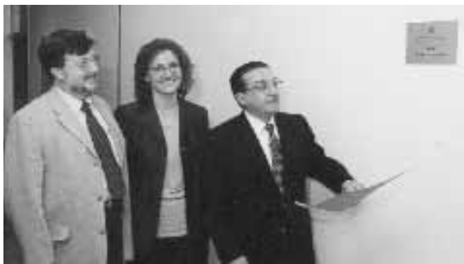
La vicerectora de Professorat, en un moment de l'acte.