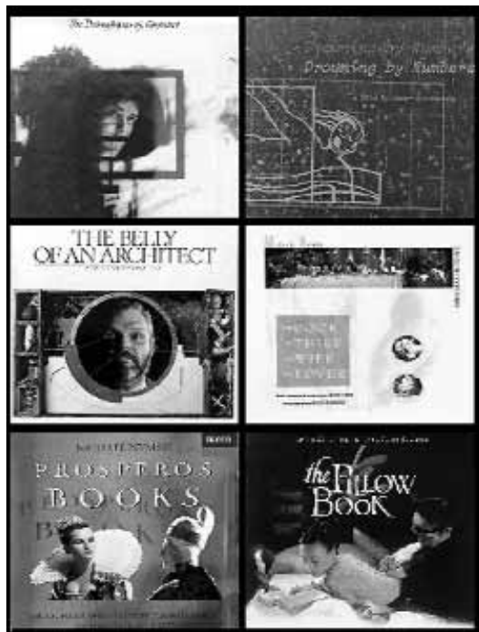
Algunes de les pel·lícules de Peter Greenaway.

L'oferta cultural es completa amb la programació de l'Aula de Cinema de la Universitat, que ha preparat un cicle sobre el director Peter Greenaway, el qual tenia previst oferir una conferència ahir dia 9 a la Universitat, de la qual informarem extensament el proper número de NOU DISE. Així, el