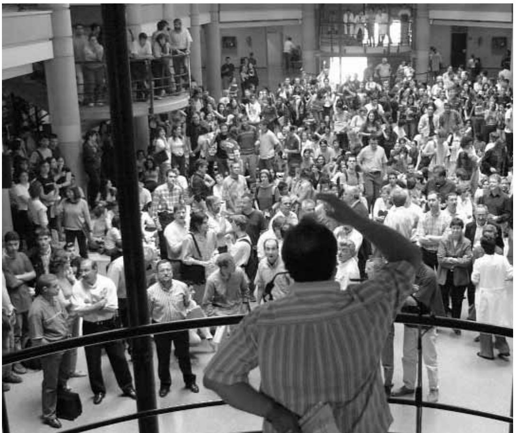
Un moment de l'assemblea celebrada a Burjassot el passat 21 de maig.