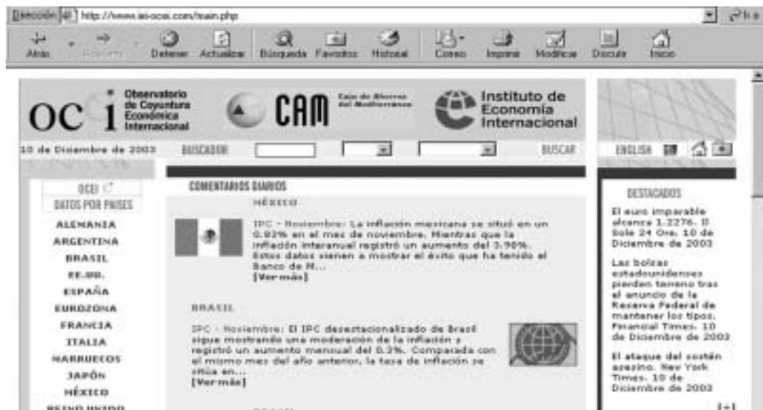
Imatge del portal de l'Observatori de Conjuntura Econòmica Internacional.