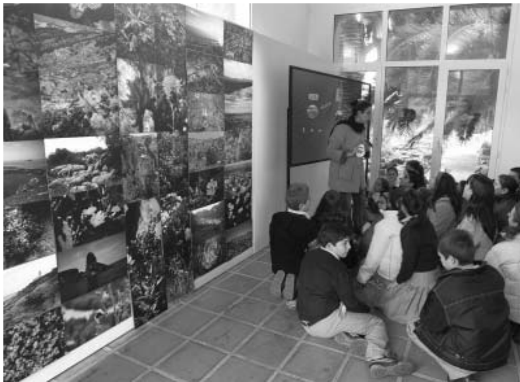
Un grup de xiquets atenen les explicacions sobre la mostra inaugurada al Botànic dimarts passat.