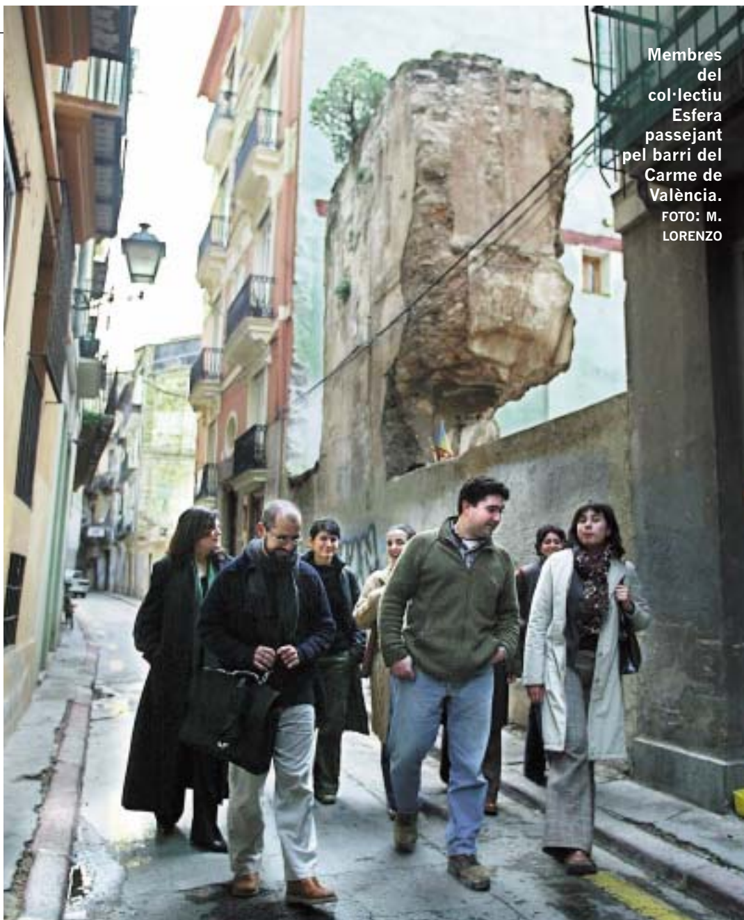
Membres del col·lectiu Esfera passejant pel barri del Carme de València.

A més, planteja que el valor de les restes de la muralla, com a Bé d'Interés Cultural, no rau només en el fet que siguin les restes de la fortificació d'època islàmica. El seu valor està unit de forma inseparable al del barri perquè formen part del conjunt en què s'integren i que els va absorbir poc després de la reconquesta. Aquella absorció va ser el que va possibilitar la seua conservació. La recuperació de la muralla és un dels problemes més importants als quals s'enfronten els habitants. Així, qualsevol persona pot veure les crítiques dels veïns a aquesta actuació que suposa l'expropiació d'edificis que ara estan habitats. "El fet d'expulsar d'eixa manera els veïns del barri el degrada. No s'entén eixa acció que vol fer l'administració per a recuperar-lo, a nivell europeu no s'entén", apunta Pacheco, qui afegeix que "a la població que hi ha ara se li lleven serveis i qualitat de vida i se'n va. La que ha de vindre no troba elements d'atracció, només l'aire bucòlic d'aquest espai que és impossible d'evitar,