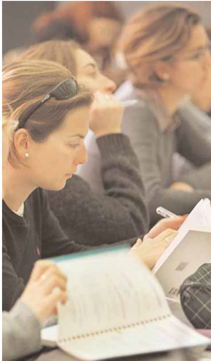
Estudiantes de la Universitat de València.

L'equip rectoral ha obert la possibilitat de participar en la concreció del Pla Estratègic a totes les persones que integren la Universitat –PDI, PAS, estu-