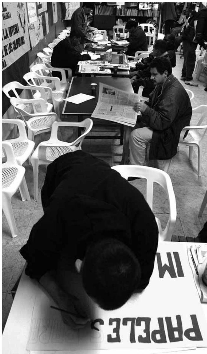
Imatge d'una acció de voluntariat en la qual va participar una associació de la Universitat.

MÉS PARTICIPACIÓ. L'objectiu del cens és, d'una banda, promoure,