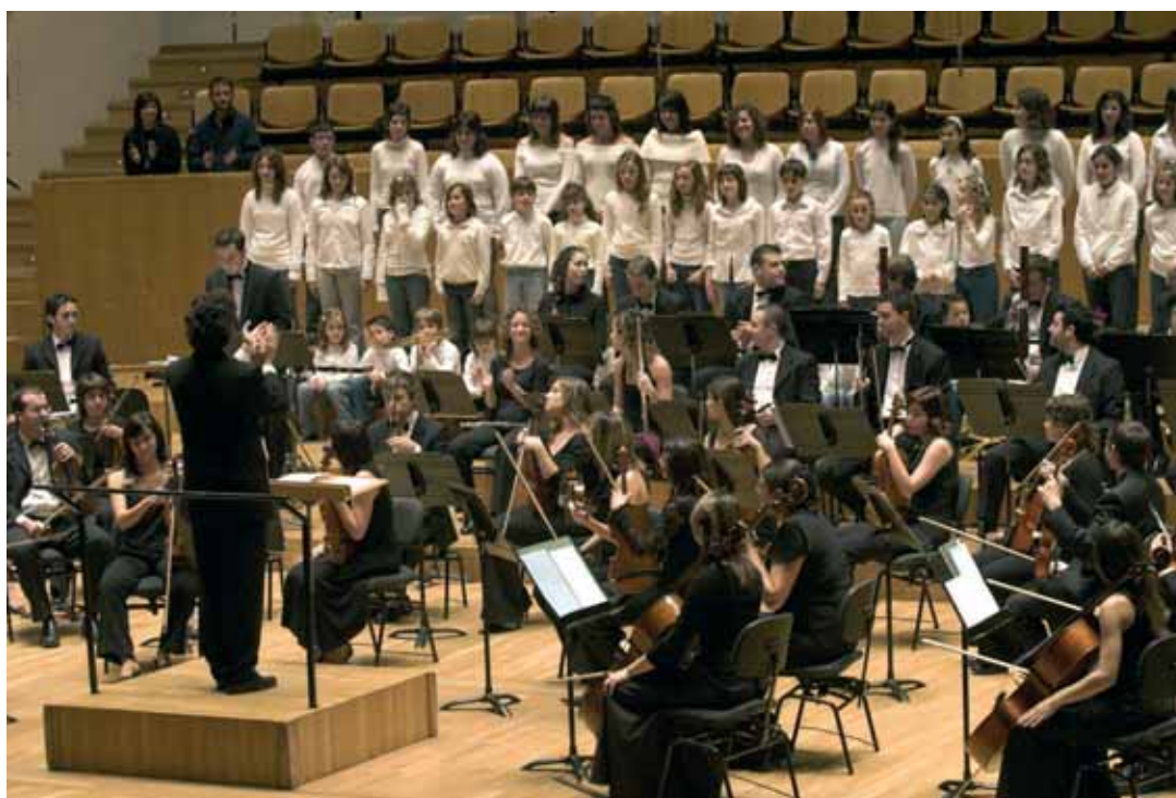
Orquestra Filharmònica de la Universitat de València.

En la segona part s'afegiran més de cent xiquets i xiquetes cantaires (Cor Andarella, Escola Coral de la Unió Musical d'Almansa, Schola Cantorum d'Aldaia, Cor Melisma de l'Escola de Música Camp de Morvedre i Cor Tramuntana de