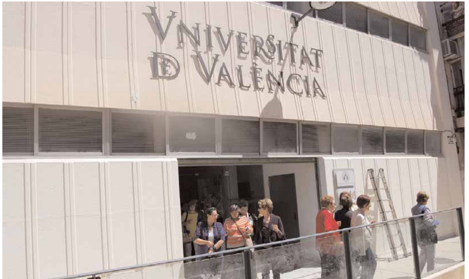
Imatge de la façana de les instal·lacions del Centre Internacional de Gandia.

El nou edifici té una extensió de 1.043 metres quadrats i compta amb quatre aules, una de seixanta places, una altra amb cabuda per a noranta persones i dues més per a huitanta. Una d'aquestes aules funciona també