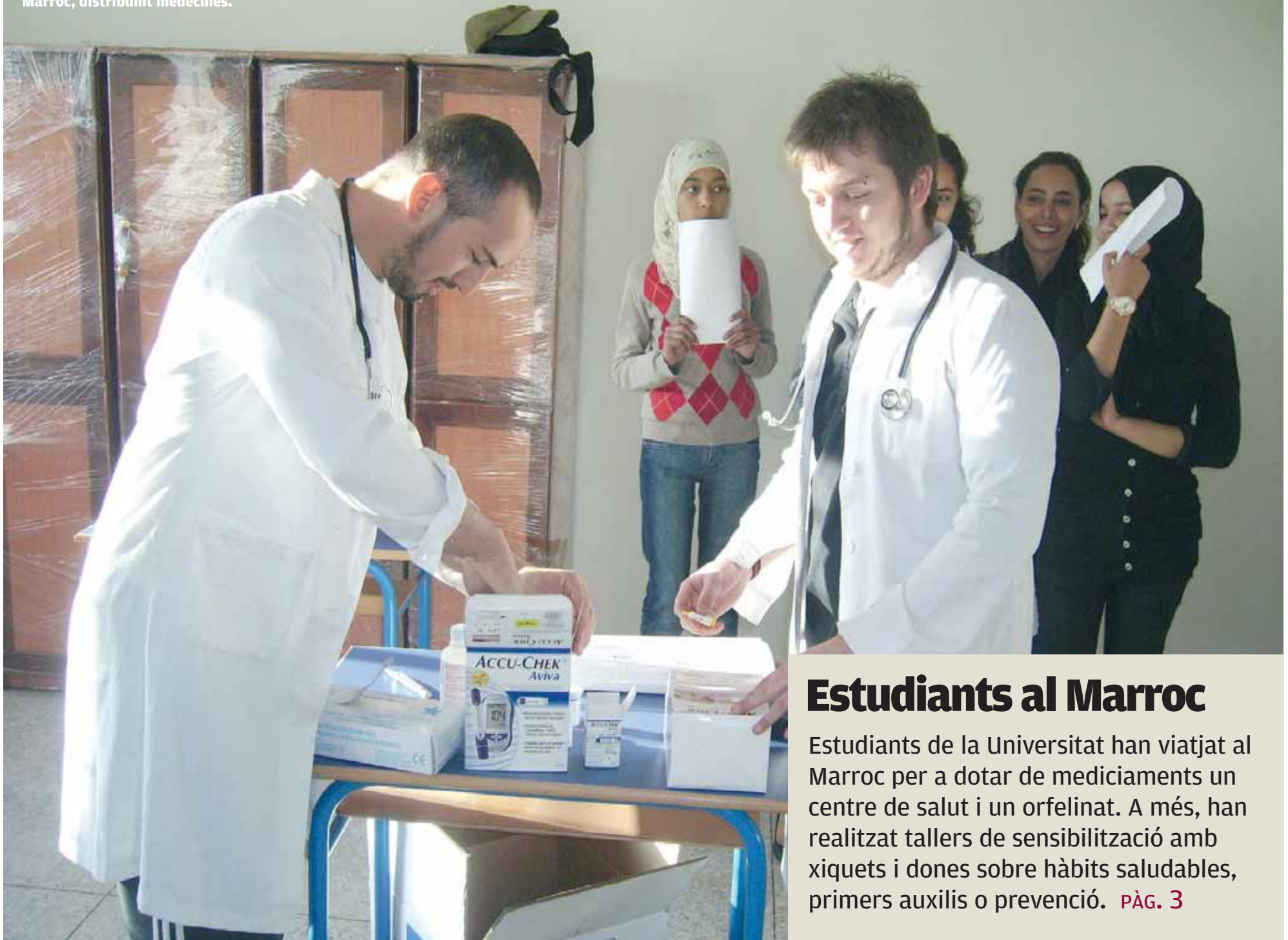
Dos dels estudiants que viatjaren a Marroc, distribuïnt medicines.

Els joves que volen trobar faena no poden quedar-se parats, aquest és el primer consell dels experts en empleabilitat. I el mateix li passa a la Universitat, perquè la inserció laboral dels titulats és un dels seus principals objectius. Per això s'ha creat el META, un programa que treballa perquè els joves que han finalitzat els estudis troben ocupació o posen en marxa iniciatives emprenedores. La segona edició del programa ja s'està celebrant. PÀG. 7