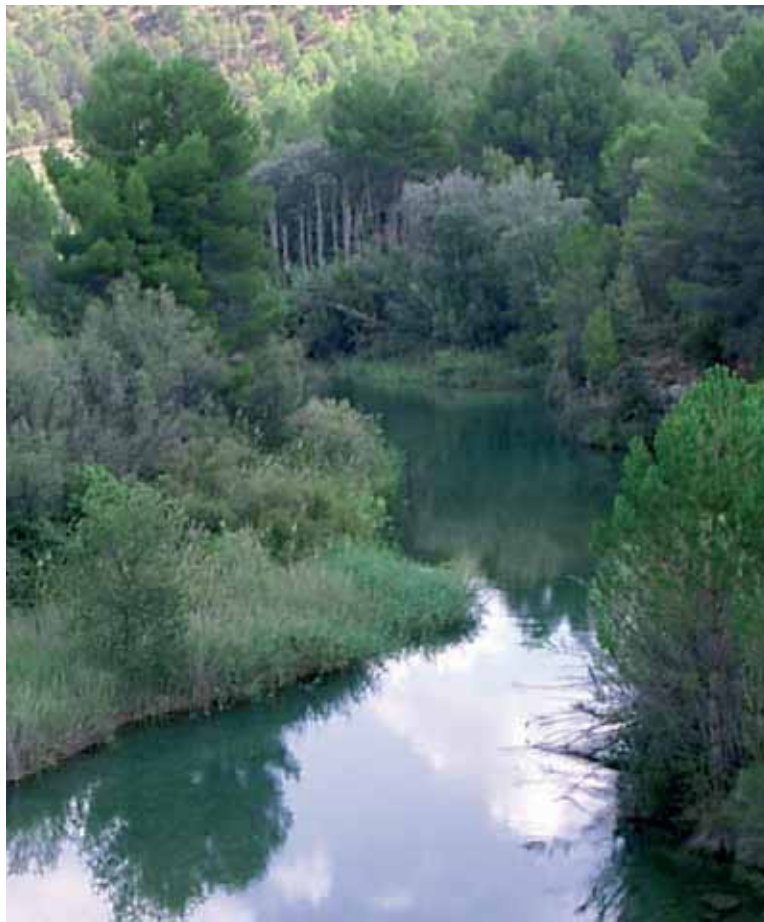
Imatge de les Gorges del Cabriol.