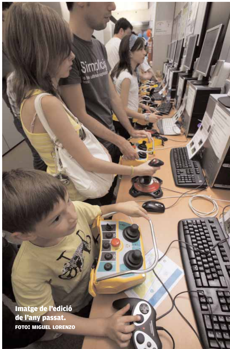
Imatge de l'edició de l'any passat.

El Parc Científic constitueix un espai de col·laboració que vincula la investigació universitària i el seu potencial científic, fomentant els processos d'innovació i la generació d'empreses de base tecnològica. El complex compta amb una superfície total de dos-cents mil metres quadrats dividits en dues zones: l'Àrea Acadèmicocientífica, on se situen els centres i instituts d'investigació, i l'Àrea Empresarial. El Parc Científic és un pol