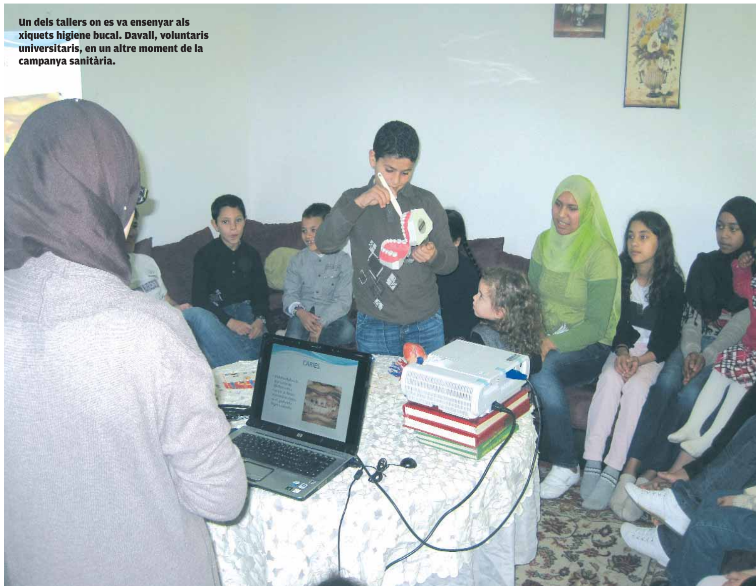
Un dels tallers on es va ensenyar als xiquets higiene bucal. Davall, voluntaris universitaris, en un altre moment de la campanya sanitària.

VOLUNTARIS. L'ONG universitària ACMAS ha realitzat una campanya informativa i sanitària amb xiquets i dones