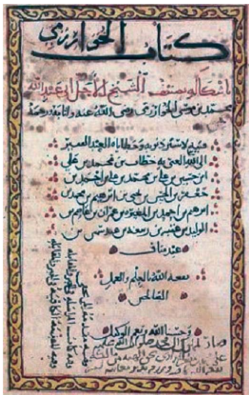
Portada del manuscrito de la biblioteca Bodleyan de Oxford del álgebra de al-Khwārizmī

No me refiero a quienes han atribuido a al-Khwārizmī, al igual que al conjunto de la ciencia árabe medieval, el papel de meros intermediarios entre el pasado glorioso de la matemática griega clásica y la matemática que renace en el occidente cristiano después de años oscuros. El competidor al que me refiero es el libro que Aydin Sayili ha editado y traducido al turco y al inglés con el título Logical Necessities in Mixed Equations , escrito por un ‘Abd al-Hamīd Ibn Turk en la misma época en que al-Khwārizmī escribió el suyo (Sayili, 1962), y que ya el nieto del autor del libro, que también era matemático, que vivió a finales del siglo IX y principios del siglo X, y a quien se conoce con el nombre de Abū Barza, habría afirmado que el libro de su abuelo era anterior al de al-Khwārizmī (Djebbar, 2005, pp. 44-45).