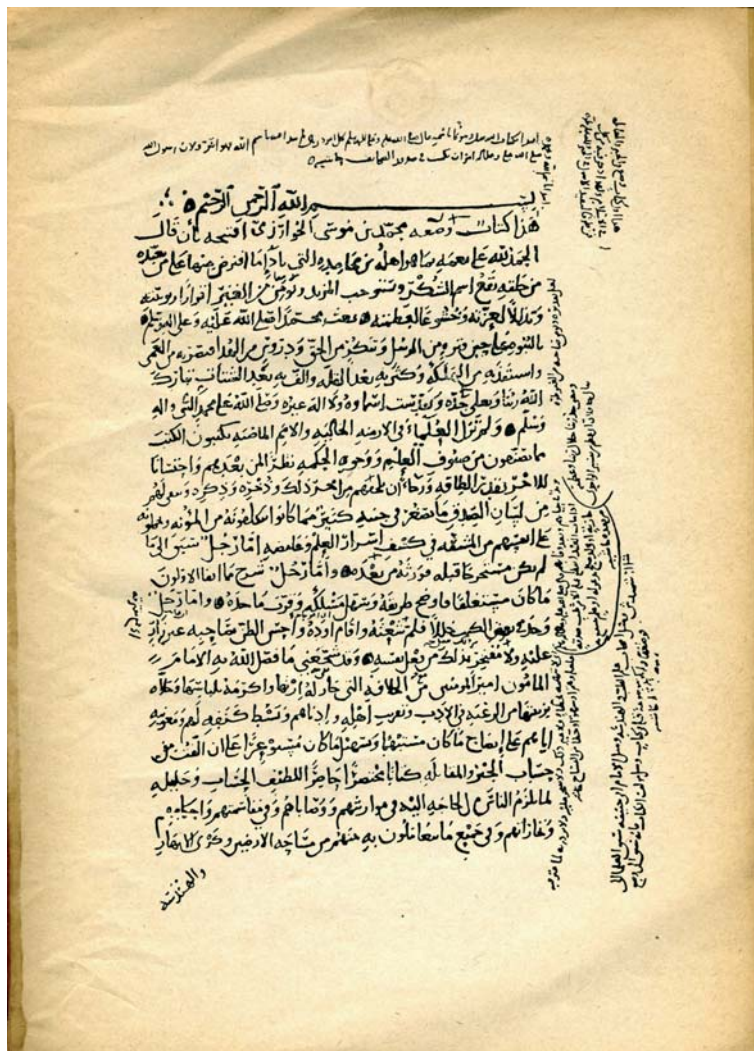
Primera página del manuscrito de la biblioteca Bodleian de Oxford del álgebra de al-Khwārizmī

Abū Kāmil va en su reivindicación mucho más lejos de lo que el propio al-Khwārizmī se atribuía, y probablemente barre para casa (aunque él fuera egipcio, como atestigua que se le conociera como al-Hāsib al-Misrī, el calculista egipcio).