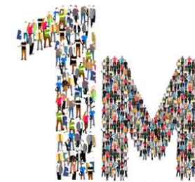
Dia Internacional Del Treball

Amb tot, convé recordar que la història ens demostra que els drets es defensen, si no volem perdre'ls.