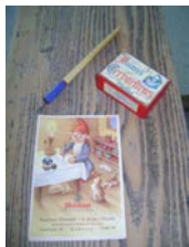
Foto 3. Pluma y papel secante

También, se muestra en esta sección algunos recursos didácticos que se empleaban en las escuelas de ayer como el franelograma utilizado para las explicaciones de la materia de Geografía (mapa de España con los límites) o de Ciencias Naturales (los animales domésticos). Además, en esta parte de la exposición, se habilitó un espacio dedicado a los materiales audiovisuales, con un proyector de diapositivas y de películas de cine, que sirvieron de apoyo en las explicaciones de los maestros.