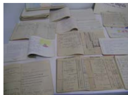
Foto 9. Actividades de contabilidad