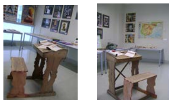
Foto 2. Pupitre unipersonal

Hay que recordar que el mobiliario escolar está lleno de historia, y como testimonio vivo del pasado, nos permite analizarlo. En la exposición encontramos un pupitre unipersonal que representa el mobiliario que se podía encontrar en un aula de una escuela pasada. Este pupitre está hecho de madera tradicional. Posee un tablero inclinado y abatible que deja, debajo de él, un cajón para colocar libros y material escolar. En el tablero hay un agujero y una ranura para poner el tintero y la pluma. El asiento está formado por un banco sin respaldo, formando todo ello una única pieza.