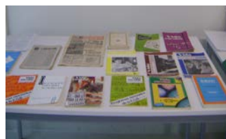
Foto 15. Revistas pedagógicas