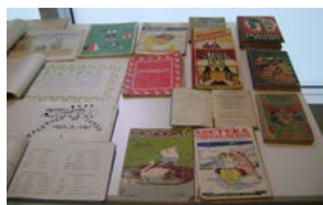
Foto 6. Cartillas, libros de lectura y Enciclopedias