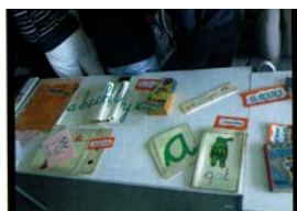
Foto 4. Material didáctico lecto-escritor, láminas de religión, mapa físico de España