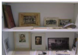
Foto 12. Documentos y fotografías de una clase de la época franquista