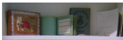
Foto 11. Libros de costura, utensilios y trabajos de la clase de labores