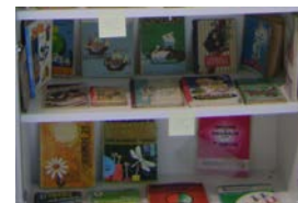
Foto 7. Libros de texto