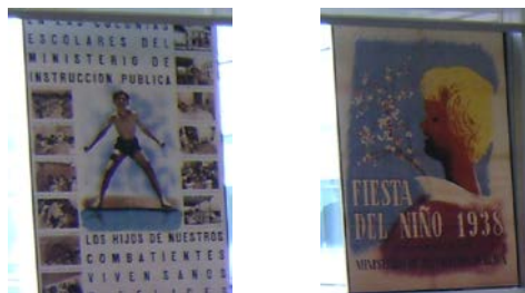
Foto 13. Cartel publicitario de las colonias y de la Fiesta del año 1938

ideas principales, se tienen que presentar por medio de frases que utilicen el vocabulario específico de la materia, y además, tienen que tener agarre publicitario. Las frases tendrán que ser cortas y de fácil comprensión. El texto se tiene que combinar con imágenes expresivas e impactantes.