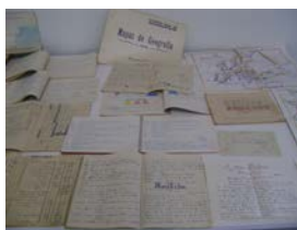
Foto 8. Actividades de sociales Matemáticas y lenguaje

Los cuadernos, mapas, trabajos manuales y todas las diferentes actividades escolares, son materiales de primera mano para los investigadores porque permiten conocer y reconstruir mejor el contexto histórico educativo y los métodos pedagógicos utilizados. Además, este tipo de material facilita la utilización del pensamiento crítico para su análisis.