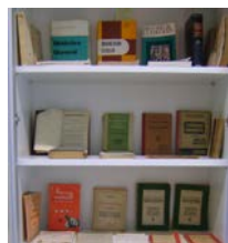
Foto 14. Libros de texto de Magisterio

En esta sección, también se muestran ordenadas cronológicamente, prensa y revistas especializadas con artículos escritos por maestros e inspectores. Entre las diversas publicaciones expuestas están varios números de Cuadernos de Pedagogía , Bordón , Vida escolar , publicada por CDODEP, y de Orientación Pedagógica , que era un boletín de la Inspección de Enseñanza Primaria.