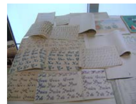
Foto 10. Copias de Caligrafía