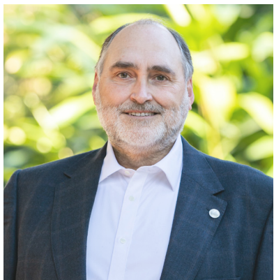
Carlos Hermenegildo Investigació