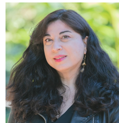
Esther Alba Cultura i Societat