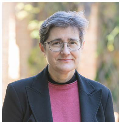
Rosa Donat Transferència i Innovació