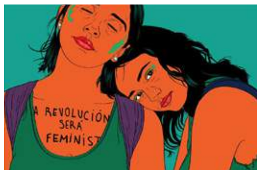
M. M. Acha-Kuscher. La revolució serà feminista, 2018 (Buenos Aires). Dibuix digital basat en la foto de Natacha Pisarenko.