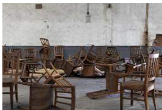
Soledad Córdoba. Devastació III, 2015. Tintes pigmentades en paper baritatat sobre dibond (emmarcat), 100 x 150 cm