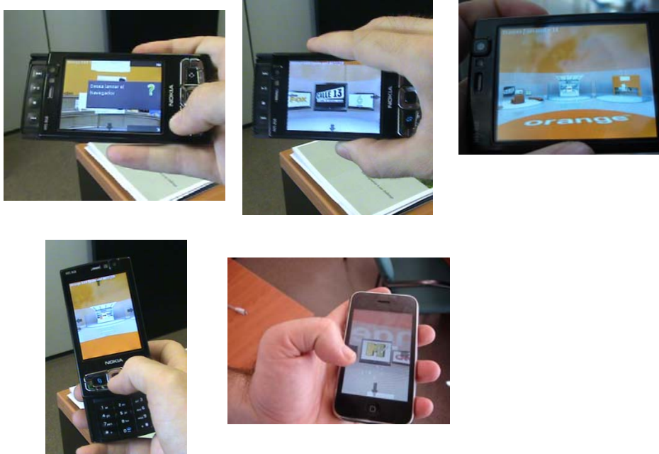
Figura 2. Diferentes imágenes del entorno 3D y el interfaz con un Nokia N95 y con un Iphone.