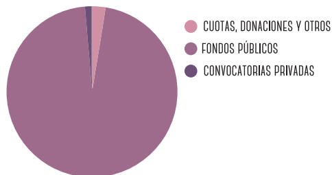
ORIGEN DE LOS FONDOS