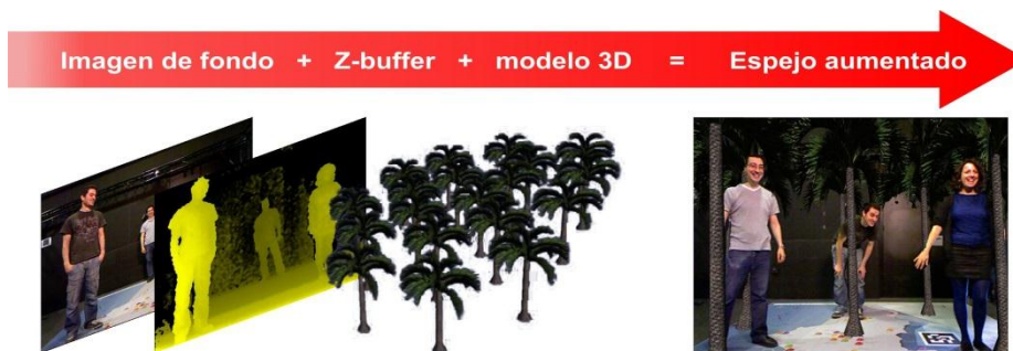
Fig. 3. Composición de una escena aumentada utilizando información de profundidad.