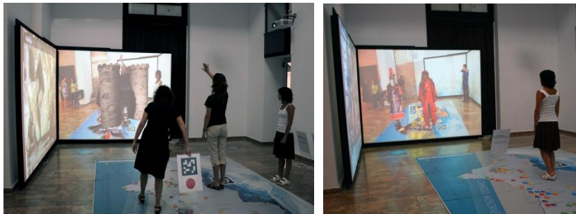
Fig. 4. Modelo 3D animado (izda.); disfraz aumentado (dcha.)

Finalmente, cualquiera de los visitantes puede viajar a otro punto de interés, o cambiar la temática, repitiendo los pasos descritos previamente.