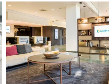
ILUNION PÍO XII Tercer hotel CEE de la Comunidad de Madrid. 195 habitaciones