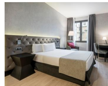
ILUNION BEL ART Nuestro segundo hotel CEE en Barcelona. 94 habitaciones