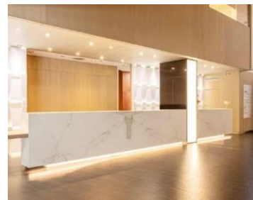
ILUNION BARCELONA Primer hotel CEE de Barcelona. 224 habitaciones