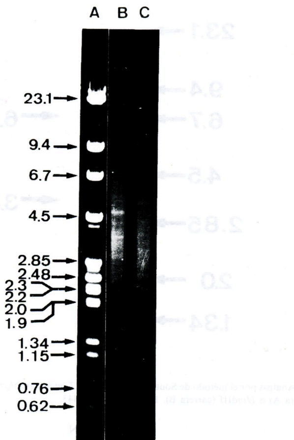
Figura 1. Análisis con endonucleasas de restricción del DNA de T. mentagrophytes . Carrera A: DNA del fago lambda y 29 digeridos con Hind III. Carrera B: DNA de T. mentagrophytes digerido con Hind III. Carrera C: DNA de T. mentagrophytes digerido con Eco RI.

Como se muestra en la Figura 1, este DNA se corta fácilmente con varias endonu-