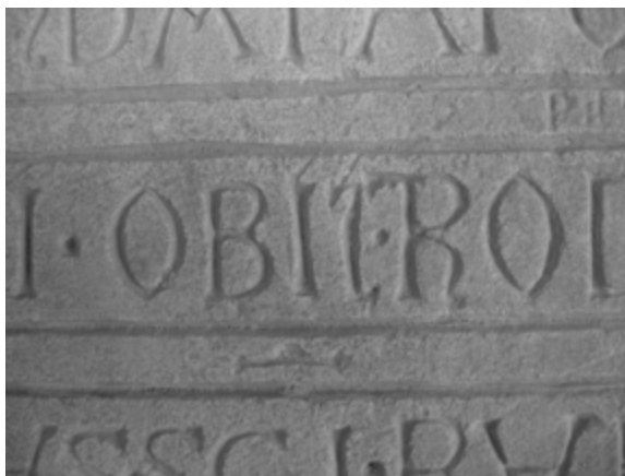
3b) Placa de Rodricus (detalle de OBI · T^R)