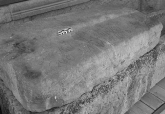
1a) Vista general del sarcófago de Fernandus