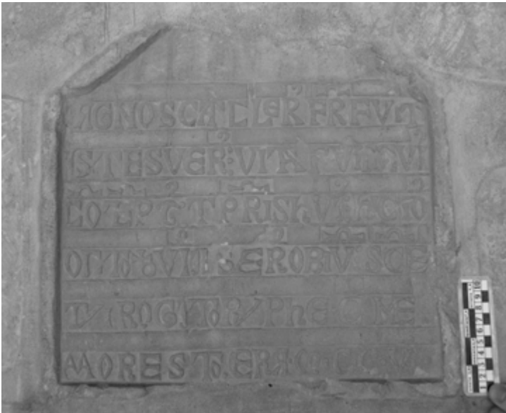
4) Placa de Suerus

sólo 17 años después de la muerte de Rodricus . Tanto la cronología como la proximidad geográfica invitan a considerar igualmente en el contexto que estudiamos petri miles –añadido probablemente a posteriori en el interlineado de la inscripción– con este sentido.