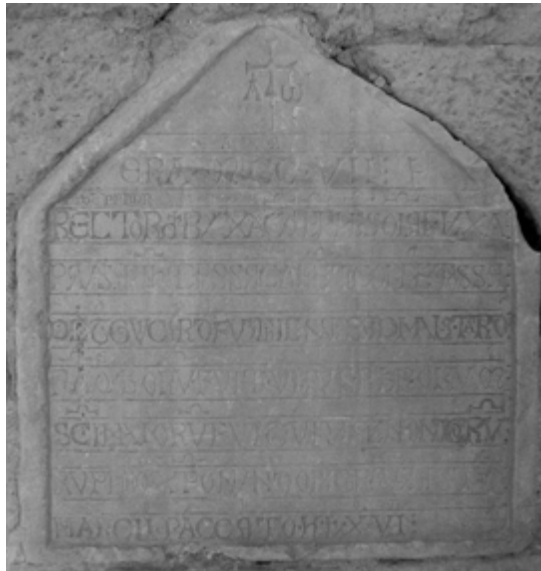
5) Placa de Guicardus