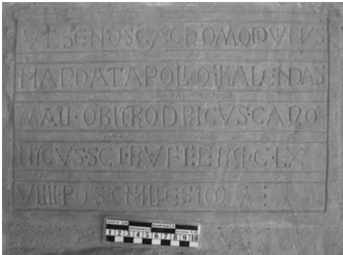
3a) Placa de Rodricus