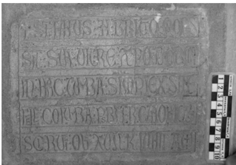
6) Placa de Stefanus

Placa rectangular de caliza ocre, empotrada en el pórtico sur de la iglesia mozárabe, a 1,50 m de altura y a 0,90 m de la puerta de acceso al coro de la iglesia. Está en buen estado de conservación.