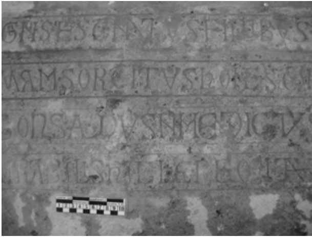
2b) Sarcófago de Gonsaldus (detalle)

Cubierta de sarcófago, de caliza blanquecina, rematada a dos aguas, con los bordes achaflanados y con faja central resaltada. Se encuentra fragmentada en tres partes que se unen entre sí, afectando las roturas al texto en sus tres primeras líneas. Fue hallada en las excavaciones de la necrópolis en 1981. Se encuentra actualmente en el interior de la iglesia románica a la izquierda de la nave, sobre un sarcófago que no debe ser el original a juzgar por sus dimensiones: 62 x 212 x 71 cm.