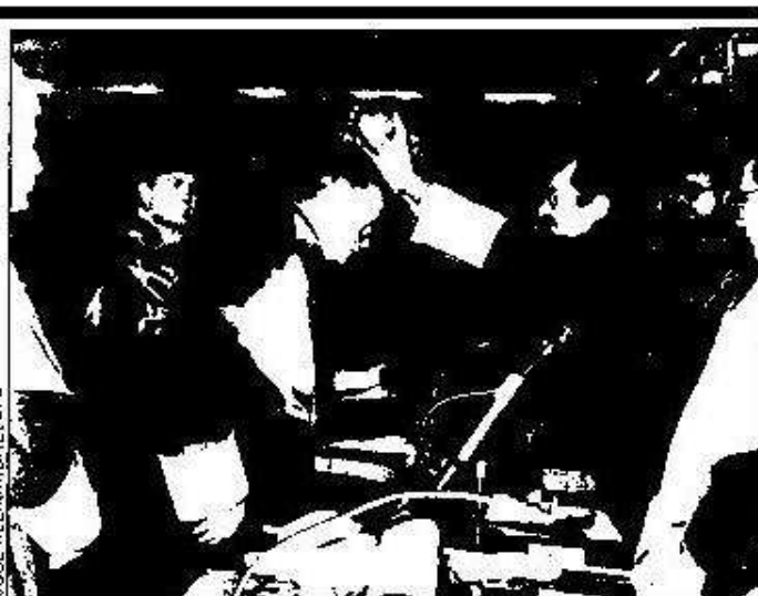
El premio Nobel James Buchanan recibió los atributos como doctor «honoris causa».