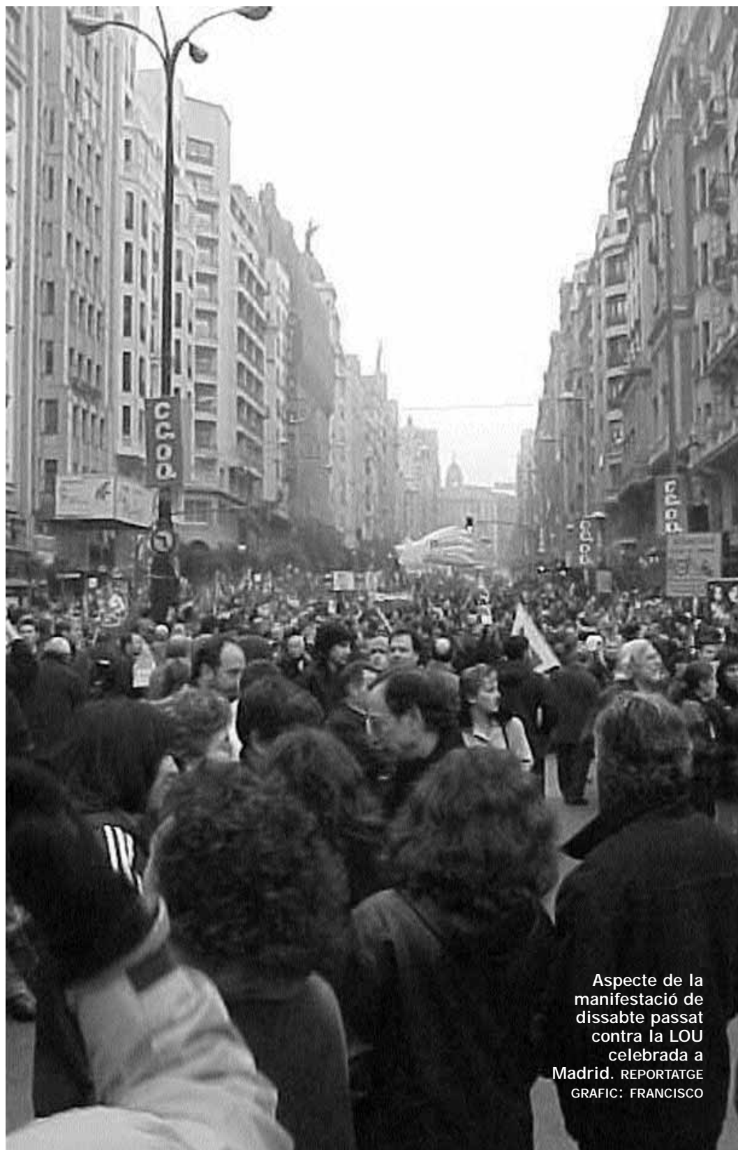
Aspecte de la manifestació de dissabte passat contra la LOU celebrada a Madrid.

Milers d'universitaris participen a Madrid en la major manifestació contra la Llei d'Universitats