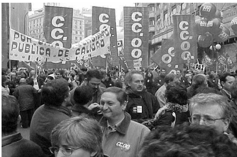
L'afluència de públic va ser massiva.