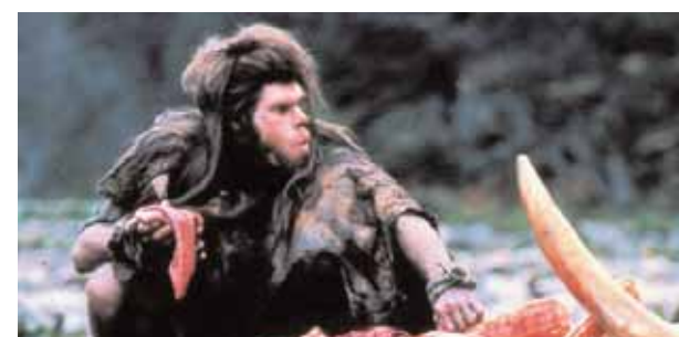
Imatges dels films Passe de tu i A la recerca del foc .

expert en el tema científic tractat en el film i un membre de l'Aula de Cinema, que abordarà els seus aspectes cinematogràfics. Les projeccions tindran lloc tots els dijous, a les 18 hores, al Palau de Cerveró, seu de l'Institut. El cicle que inaugura la col·laboració està dedicat a l'evolució, amb motiu de la celebració del bicentenari