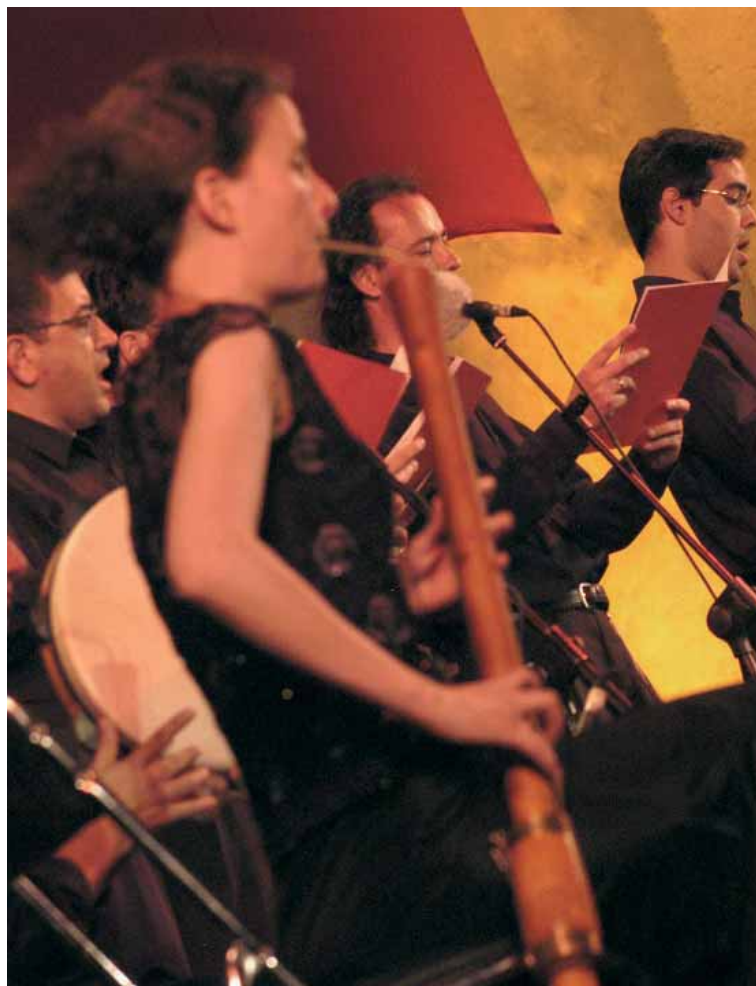
Imatge d'arxiu d'una actuació de Capella de Ministrers.

Entre altres activitats programades, cal destacar l'exposició Metamorphosis. El renaixement de dos violes valencianes del segle xv i una sèrie de conferències, previstes per al matí del dia 25, que aportaran una valuosa informació sobre la música i