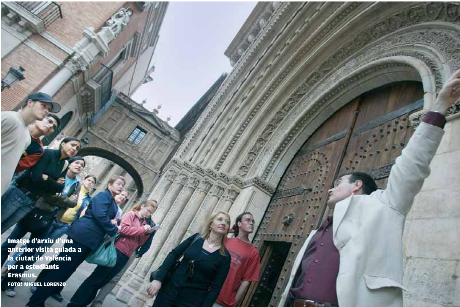
Imatge d'arxiu d'una anterior visita guiada a la ciutat de València per a estudiants Erasmus.