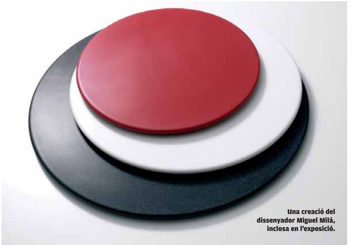
Una creació del dissenyador Miguel Milà, inclosa en l'exposició.