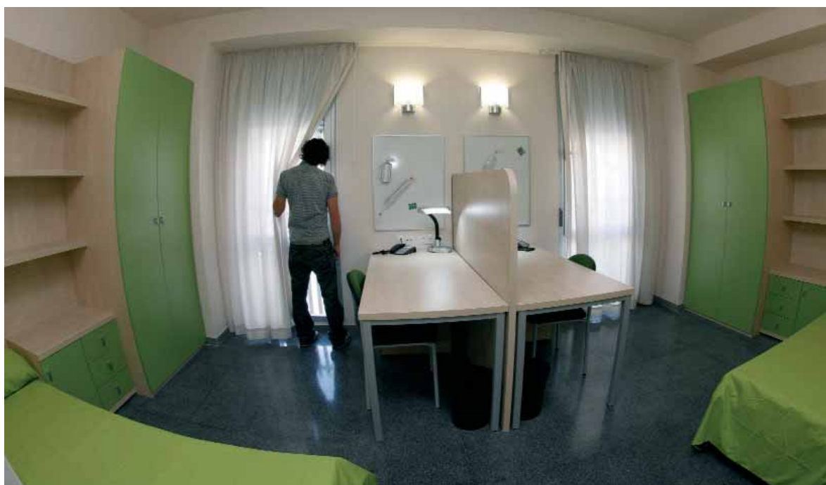
Imatge d'una de les habitacions de la residència.

EL NOM DE DAMIÀ BONET. La Universitat ha optat per posar-li el nom de Damià Bonet a la residència com a homenatge al que fou un dels jurats de la ciutat de València que promogué la petició al papa per a crear la Universitat. Per a Aurelio Beltrán, amb aquest gest es vol recordar que la institució acadèmica "és una universitat de la ciutat, que sorgeix de la ciutat".