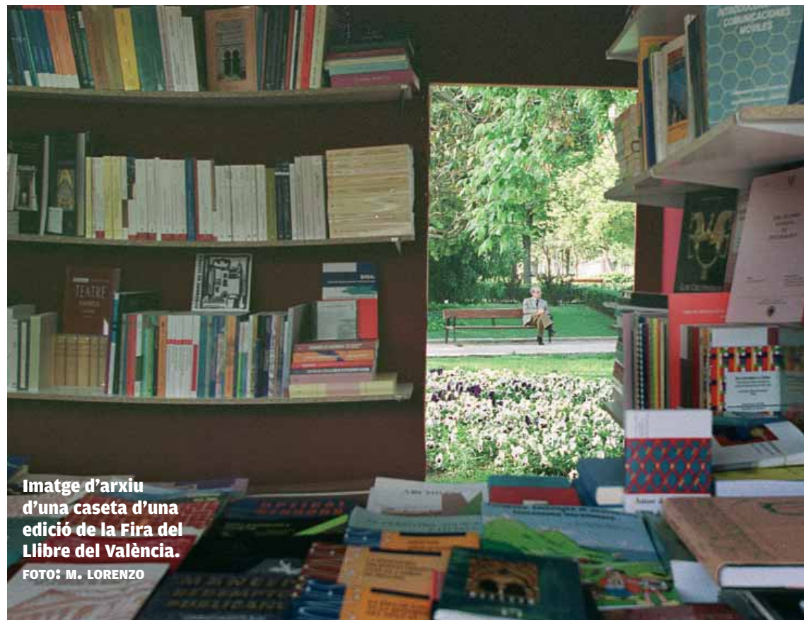
Imatge d'arxiu d'una caseta d'una edició de la Fira del Llibre del València.

L'encontre reunirà els principals responsables de les polítiques de foment de la lectura de tot l'Estat, tant en l'àmbit institucional com en el sector editorial. S'hi debatran les línies mestres d'aquest sector de la