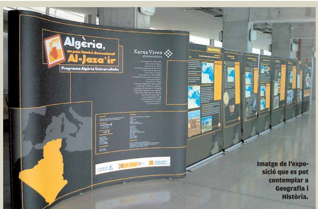
Imatge de l'exposició que es pot contemplar a Geografia i Història.