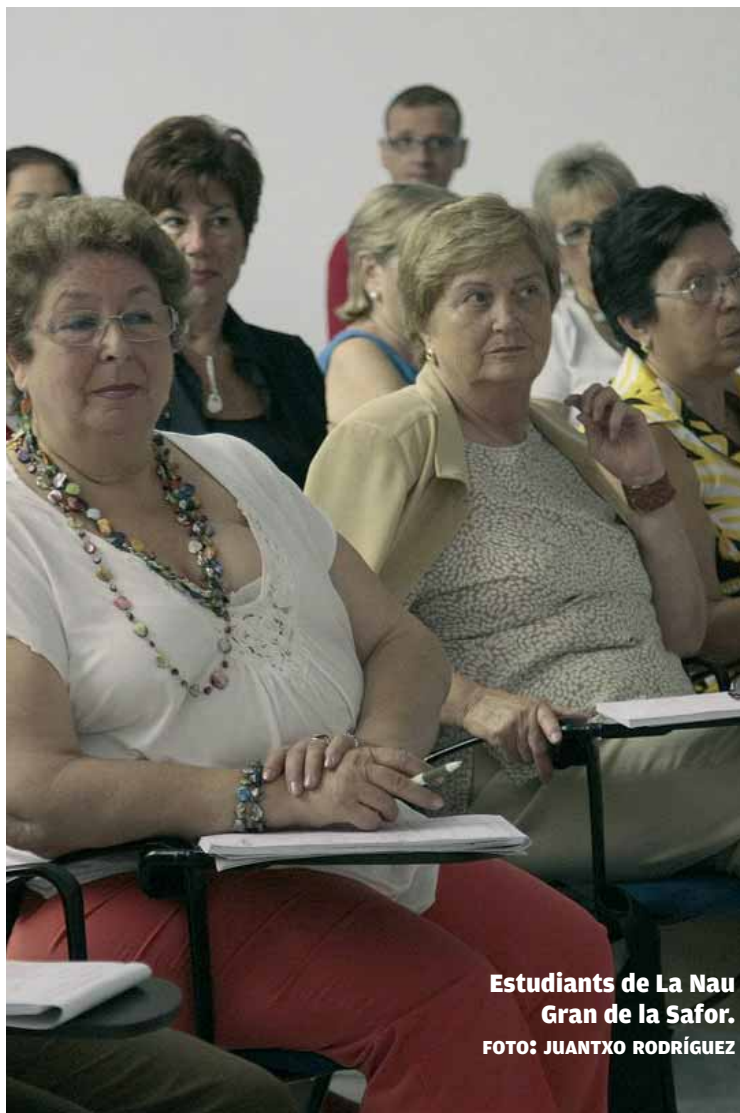
Estudiants de La Nau Gran de la Safor.

En acabar aquest curs, el Centre Internacional de Gandia comptarà amb els primers setanta alumnes de La Nau Gran que han cursat un itinerari complet. Per tal d'acreditar aquests coneixements, la Universi-