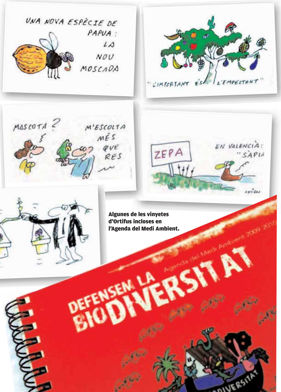
Algunes de les vinyetes d'Ortifus incloses en l'Agenda del Medi Ambient.

En el seu compromís pel medi ambient, la Universitat de València regula en el Plec de Prescripcions Tècniques la impressió, el tiratge i la distribució de l'agenda, que a més compleix en aquesta edició i que ofereix per als que vulguen seguir les recomanacions. L'agenda està penjada en la web del Servei de Seguretat, Salut i Qualitat Ambiental i es pot descarregar lliurement: www.uv.es/sssq .