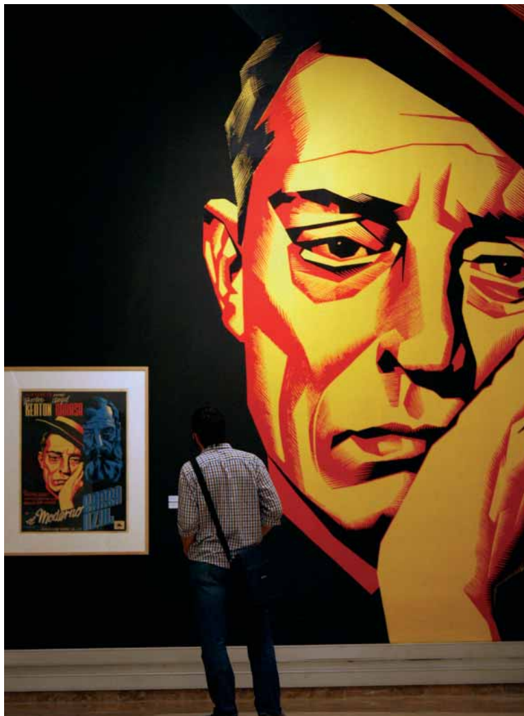
Un visitant de l'exposició quan s'exhibia a València.

La seua producció abasta quasi tots els gèneres de l'expressió visual contemporània, des de pintures de cavallet a fotomuntatges, mostrant