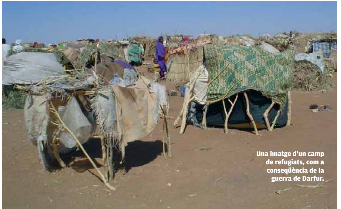
Una imatge d'un camp de refugiats, com a conseqüència de la guerra de Darfur.