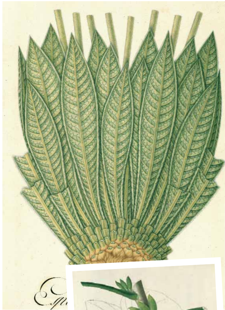
Dalt: Espeletia (Compositae) Anònim. Dreta: Arum (Araceae).

L'apartat següent, dedicat a la nova funció de Mutis com a naturalista sacerdot, empresari miner (1770-1778) , mostra com Mutis va anar adaptant al Nou Món els seus plans per a la metròpoli fins a inventar una tradició científica en el Nou Regne de Granada. S'hi explica el seu projecte de comercialitzar el te de Bogotá per iniciativa pròpia, el seu intent d'explora-