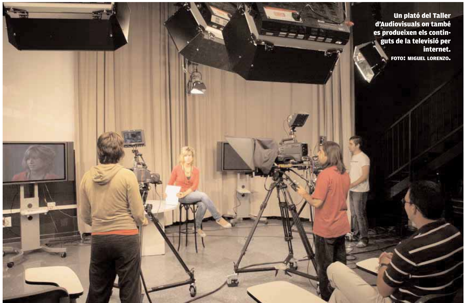
Un plató del Taller d'Audiovisuals on també es produeixen els continguts de la televisió per internet.

Aquesta plataforma allotja el canal de televisió de la Universitat de València, com també la futura ràdio de la Universitat. Junt amb aquests dos hi ha un conjunt de huit canals sota demanda que permetran a tots els ciutadans connectats a internet conèixer millor la Universitat de València i obtenir informació sobre l'actualitat de la institució. A més, es remet el senyal audiovisual de TEI, la Televisió Educativa Iberoamericana, s'enllaça al canal YouTube de la Universitat de València i permet, a tots aquells usuaris que s'hi connecten dins dels campus de la Universitat, accedir a diversos canals de televisió internacional via satèl·lit i a tota l'oferta de canals de televisió via TDT