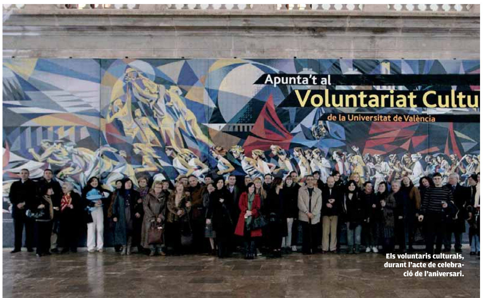
Els voluntaris culturals, durant l'acte de celebració de l'aniversari.