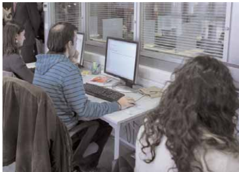
Detall de les instal·lacions inaugurades dimarts.