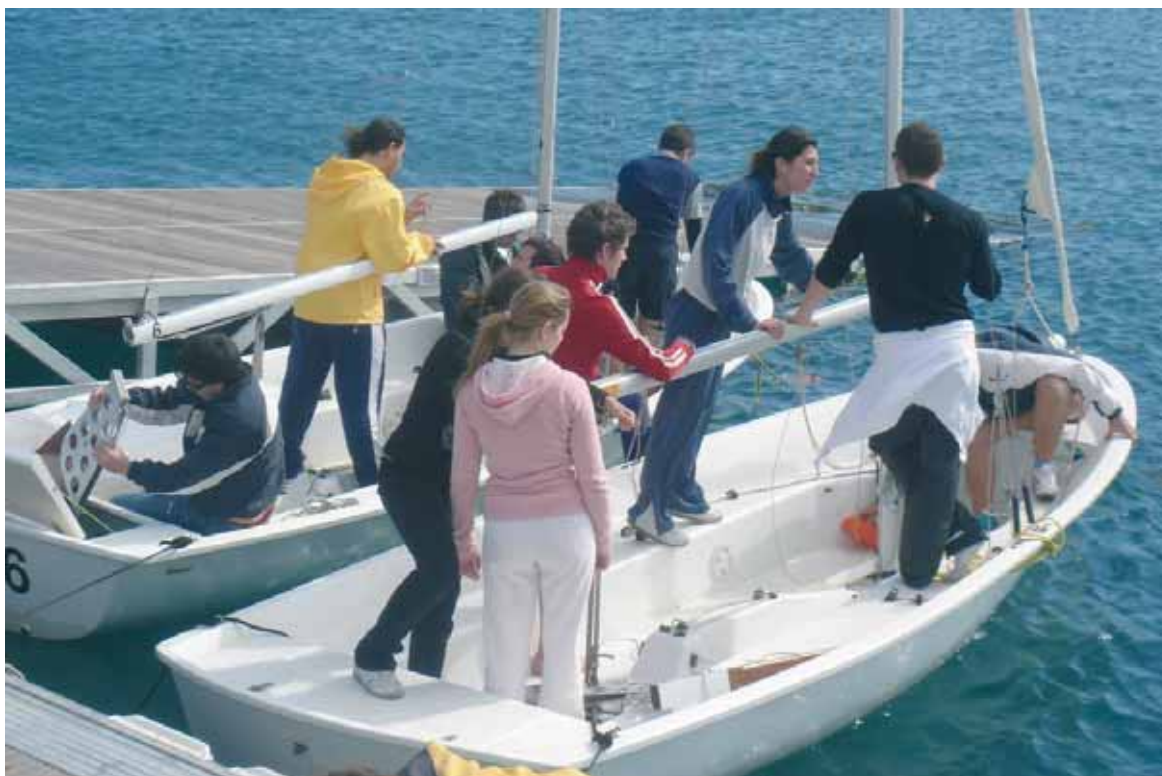
Estudiants de la Universitat en un curs de vela.

D'altra banda, la matrícula a les activitats esportives ja està oberta i es pot realitzar també a través de la web del Servei d'Educació Física i Esports.