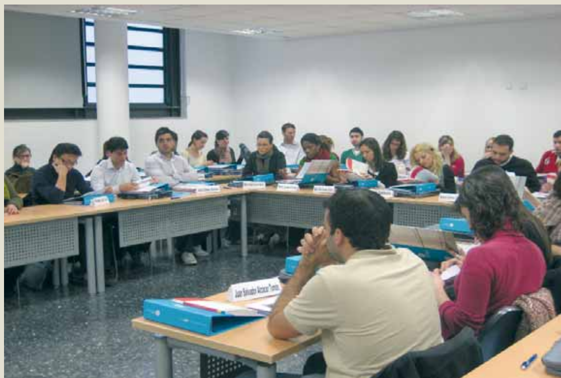
Una sessió del curs Qui pot ser empresari? , en una edició anterior.

ADEIT. Comença l'onzena edició de 'Qui pot ser empresari?'