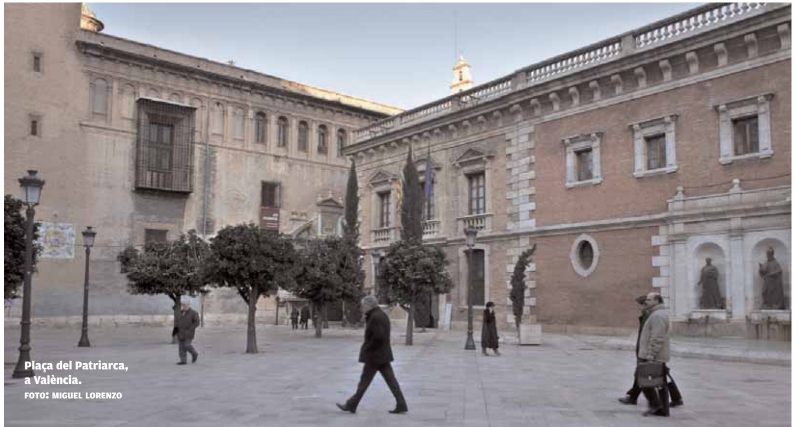
Plaça del Patriarca, a València.

El 19 de juliol del 1936 l'església dels Sants Joans de València fou incendiada. El 21 de juliol el Col·legi Seminari del Corpus Christi (més conegut com a Col·legi del Patriarca) anava a ser saquejat, però una intervenció per part del rector de la Universitat, José Puche, va poder parar l'assalt. "Va dir que la Universitat era qui confiscava el Col·legi, ja que en el seu interior hi havia llibres, art i documents que pertanyien al poble i a la