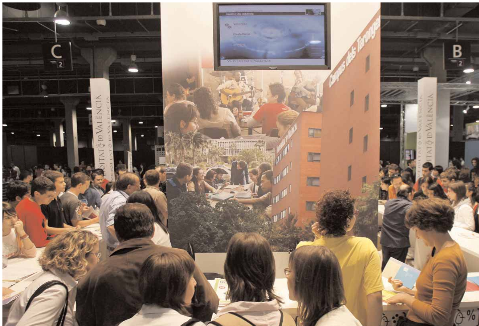
Una imatge de Formaemple@, en una edició anterior.

Del material editat destaquen la Guia per als futurs universitaris , la