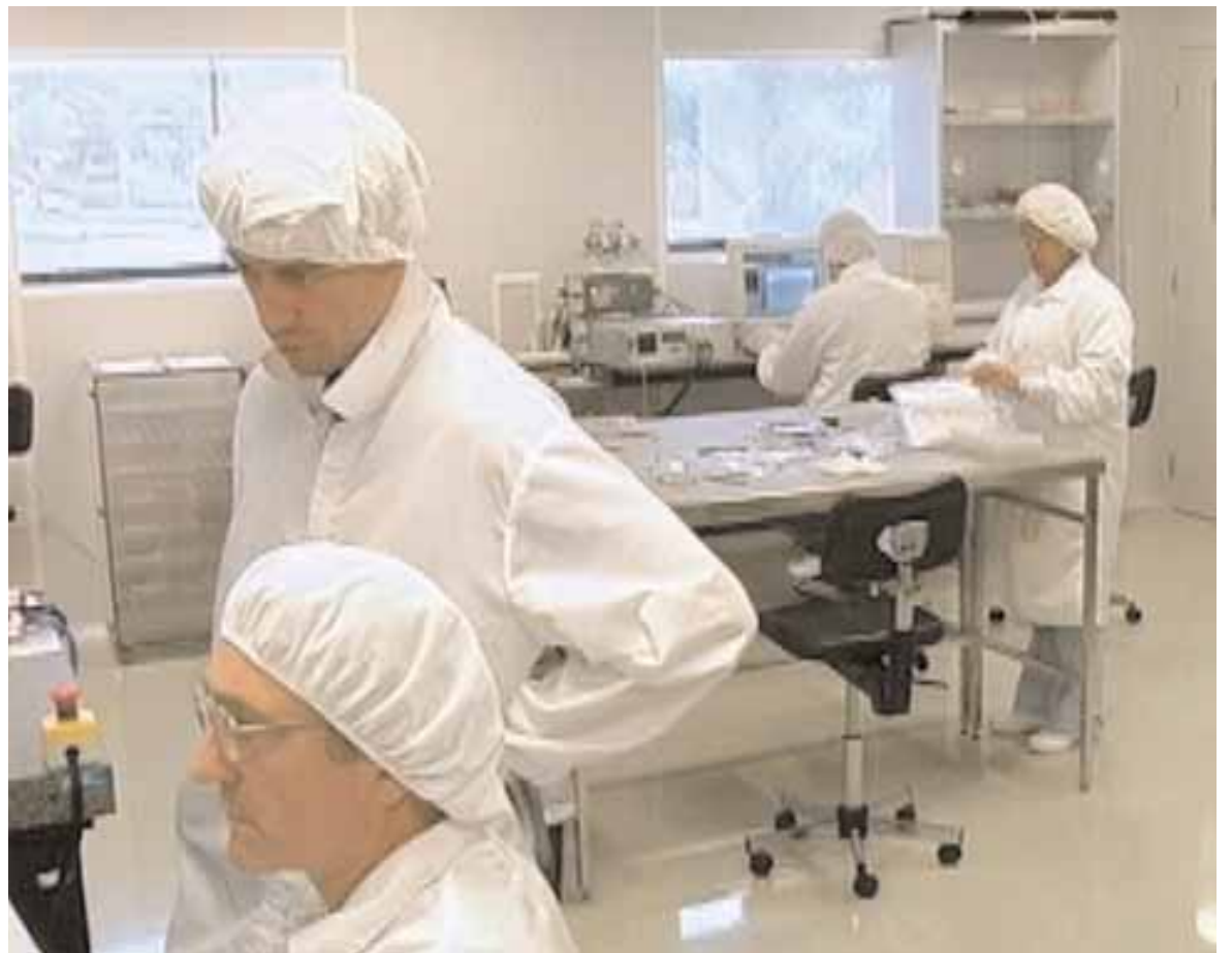
Investigadors de l'IFIC treballen al laboratori.

FUTURS DETECTORS. Segons Carmen García, "aquesta tecnologia no es realitzava a l'IFIC abans de la participació en ATLAS, però el seu desenvolupament ha permès al centre ser competitiu en projectes futurs", com ara la construcció del detector de silici que substituirà l'actual al LHC i els futurs Col·lisionadors Lineals. A més, aquesta tecnologia té aplicacions en