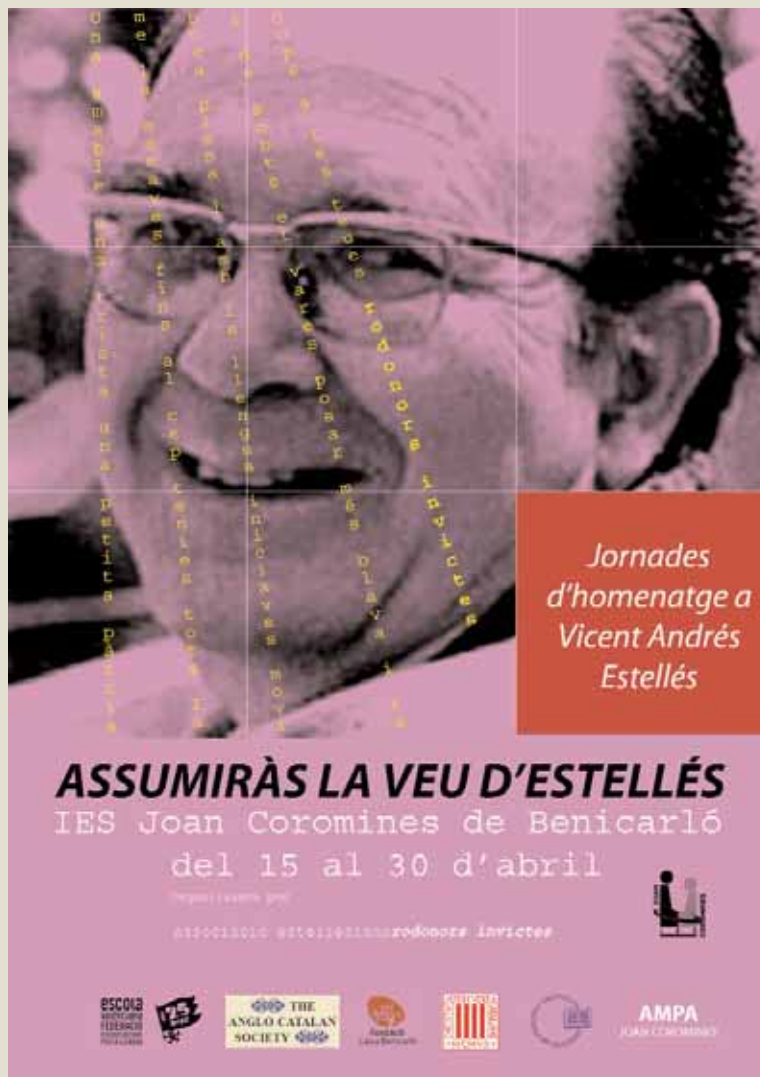
Cartell de les jornades.